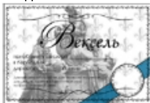
Синий вексель номинал 100