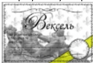
Желтый вексель номинал 50

В игре участвуют три разновидности векселя: